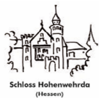
Schloss Hohenwehrda (Hessen)

„Lernen mit Kopf, Herz und Hand“ unter diesem Motto findet in der Hermann-Lietz-Schule Schloss Hohenwehrda ein Summercamp für Schülerinnen und Schüler der Klassen 5 – 7 statt.